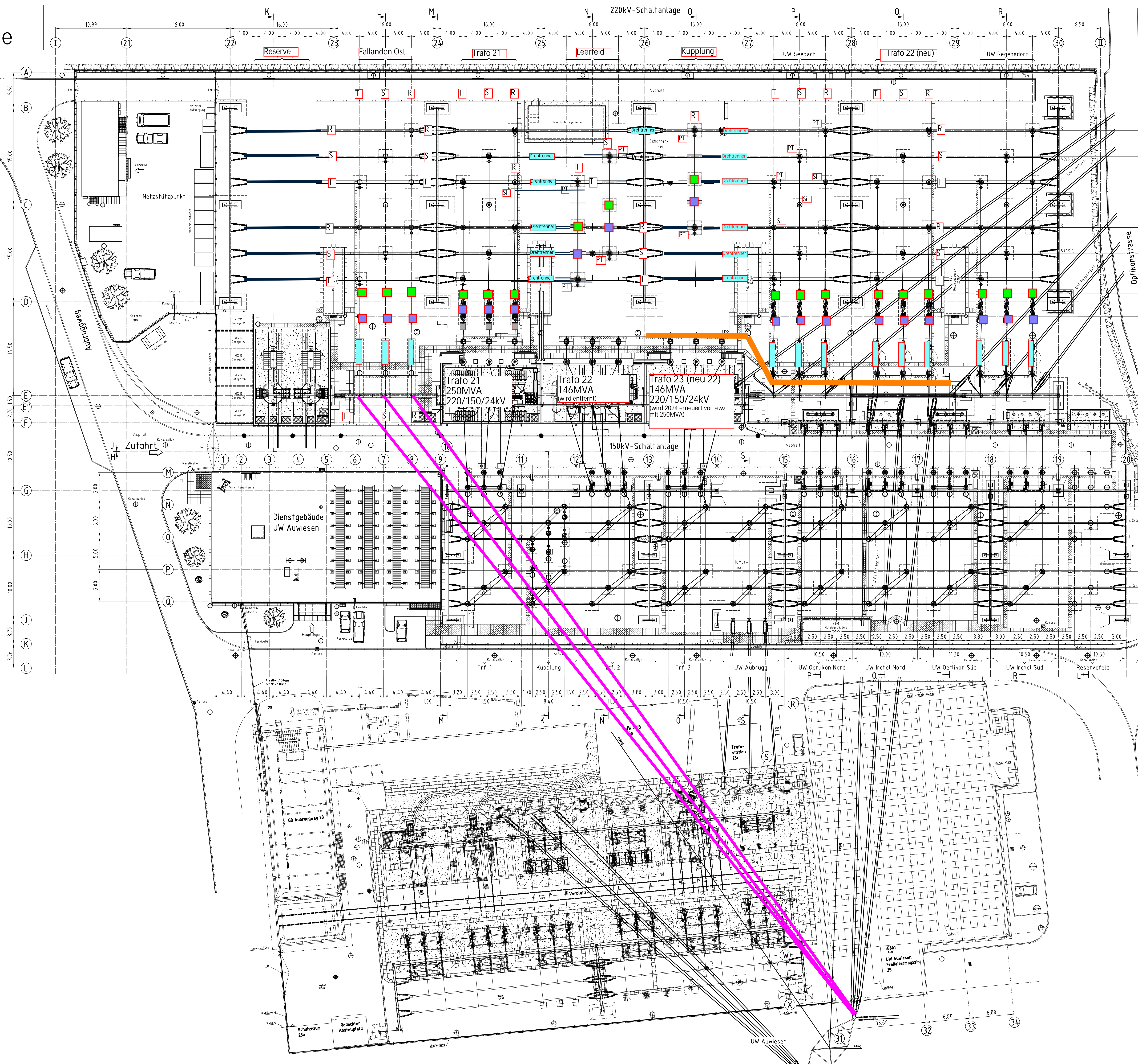
Grösse eines Drehtrenners 220kV